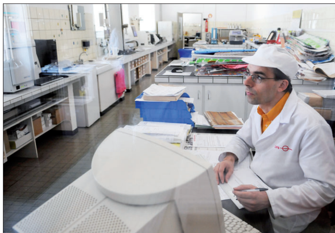
Le laboratoire effectue des tests quotidiens sur les composants et la résistance des emballages.

Devenu expert dans l'emballage alimentaire, le site d'Illfurth produit également les coussinets présents notamment dans les boîtes de chocolats. Ce petit matelas antichocs, à base de papier, peut contenir 3, 5, 7 ou 9 couches, être composé de petit ou grand gaufrage. «Nous sommes les seuls en France à le produire. Certains sont imprimés et d'autres non. Cela dépend des demandes» , complète Guillaume Moissonnier. CFS